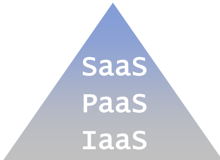
Abb. 3: Service-Layer beim Cloud Computing

Mit den Service-Layern kann sich nun eine mehrstufige Wertschöpfungskette entwickeln: Ein Unternehmen kann etwa die für seine Dienste nötige Plattform bei einem PaaS-Provider zukaufen - es ist dann Anwender (User, Kunde) bzgl. PaaS und zugleich Anbieter (Provider, Lieferant) bzgl. SaaS.